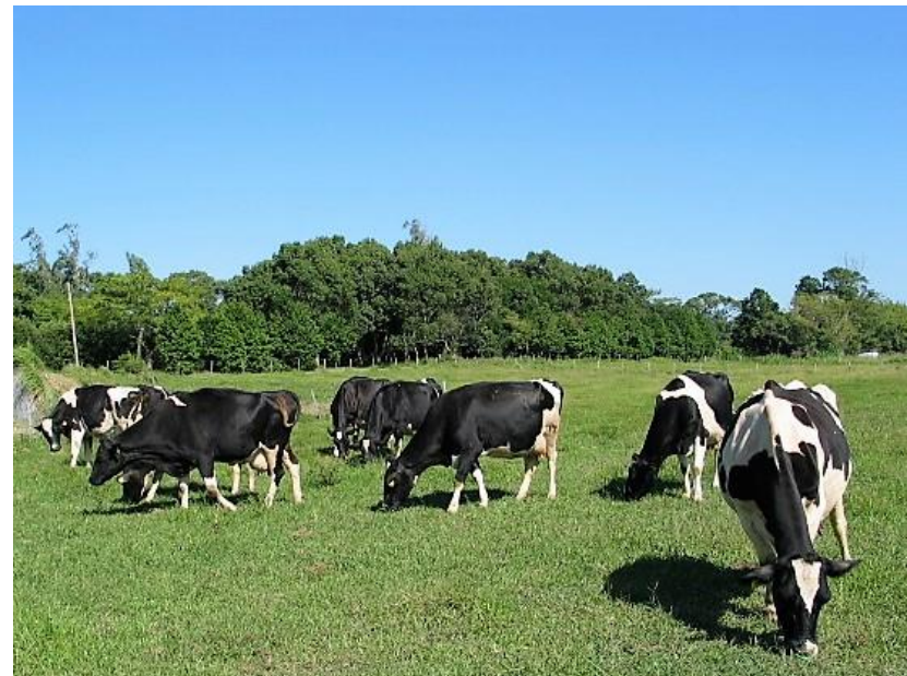
宮崎大学農学部附属住吉フィールドのウシたち